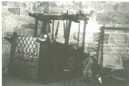
Sala dedicada a la manufactura del Lino

El "reconocimiento" a su experiencia museística se concreta en 1997, año en que el Museo queda incorporado, mediante convenio, al Sistema Español de Museos.