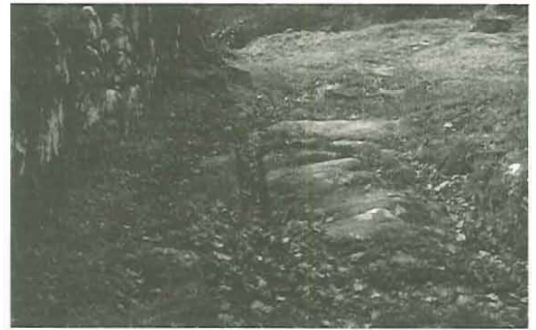
Camino interior del despoblado de Saa

- Su estado de conservación aunque a primera vista podría verse como un inconveniente, dado que queda pocas construcciones en pie, es, a juicio de diversos técnicos, una ventaja ya que permitirá adaptarse a los objetivos propuestos sin estar mediatizados por construcciones ya existentes.